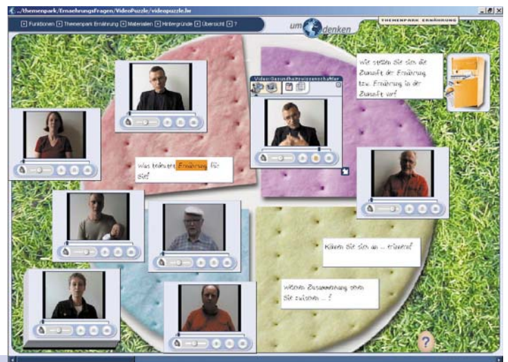
Video-Collage im »Themenpark Ernährung«